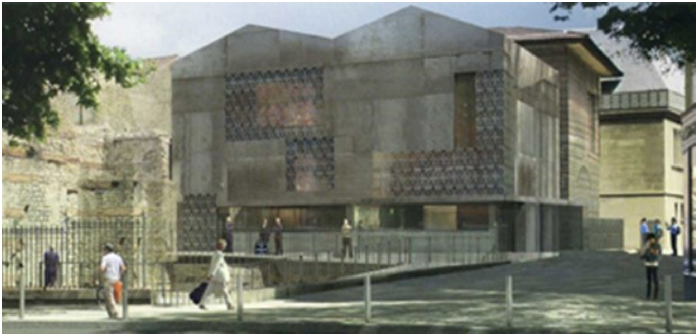
Nouveau bâtiment d'accueil du musée de Cluny : vue depuis le boulevard Saint-Michel, Paris