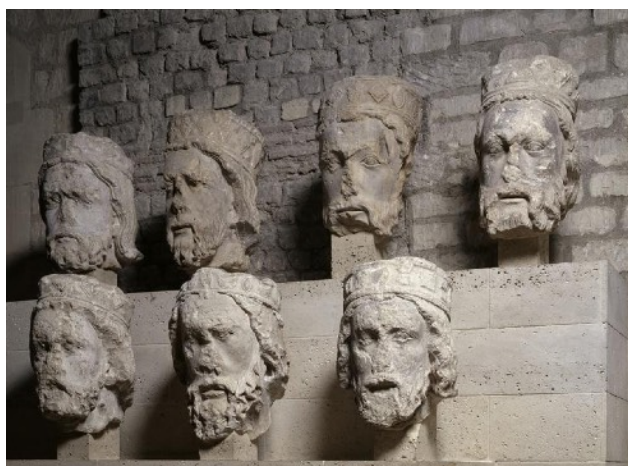
Têtes des rois de Juda provenant de Notre-Dame de Paris, Paris, musée de Cluny - musée national du Moyen Âge.

Une enfance parisienne, vécue dans un centre de la capitale légèrement déplacé vers la rive gauche, amène à parcourir inlassablement les grands axes – le boulevard Saint-Michel, la rue Saint-Jacques – et à s'aventurer jusqu'à la cathédrale Notre-Dame dans une déambulation curieuse, rêveuse, amicale ou solitaire. Les vingt-huit figures colossales (hautes de 3,70 m) qui